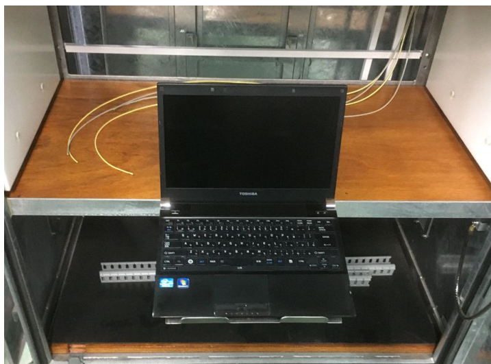
ノートパソコン設置