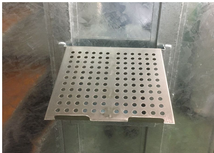
カードホルダに固定