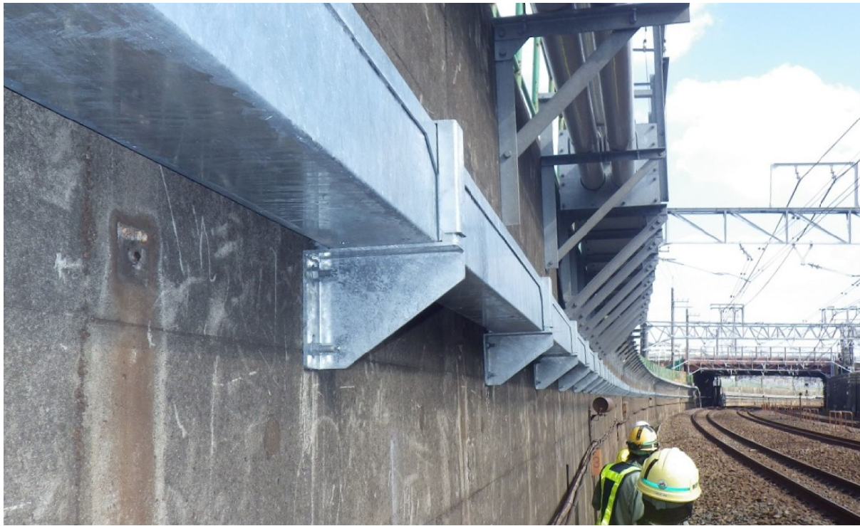
総武本線 東船橋～津田沼間取付写真